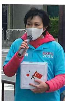
トルコ・シリア大地震 救援募金を訴える

特にトルコとの歴史的友好関係はオスマン帝国時代に遡り、1890年和歌山県沖でのエルツール号沈没の際の日本人によるトルコ人乗組員救出をきっかけに、トルコもイラン・イラク戦争時の日本人救出や東日本大震災での救援部隊の派遣などを行なった友好関係です。