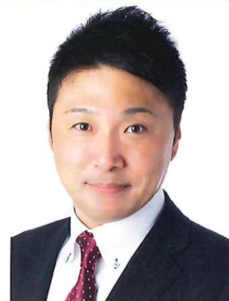
総務副会長 枚方市議会議員