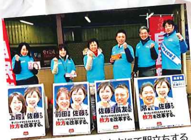
2/15 朝7時から枚方市内にて駅立ちする 自民党大阪11区支部役員