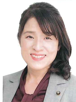
総務副会長 枚方市議会議員