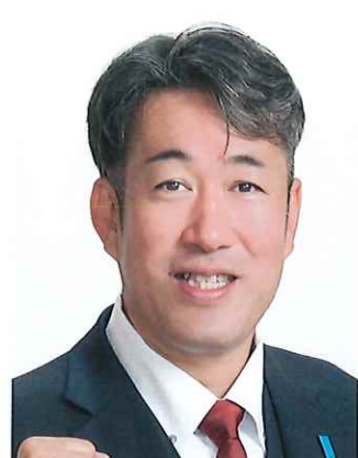
副幹事長 枚方市政対策委員