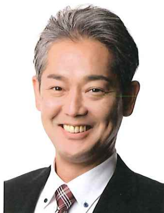
副幹事長 枚方市政対策委員

枚方をプラボーな街に！子ども から高齢者まで生き生きと暮 らせる街づくりを実現します。